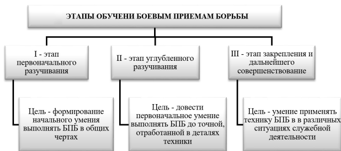
Рис. 2. Этапы обучения боевым приемам борьбы

Последовательность обучения технике боевых приемов борьбы. Техника боевых приемов борьбы – это наиболее рациональный способ их выполнения с целью достижения большей эффективности их применения при решении оперативно-служебных задач. Техника боевых приемов состоит из отдельных движений (элементов). Одни движения в этом составе являются для выполнения