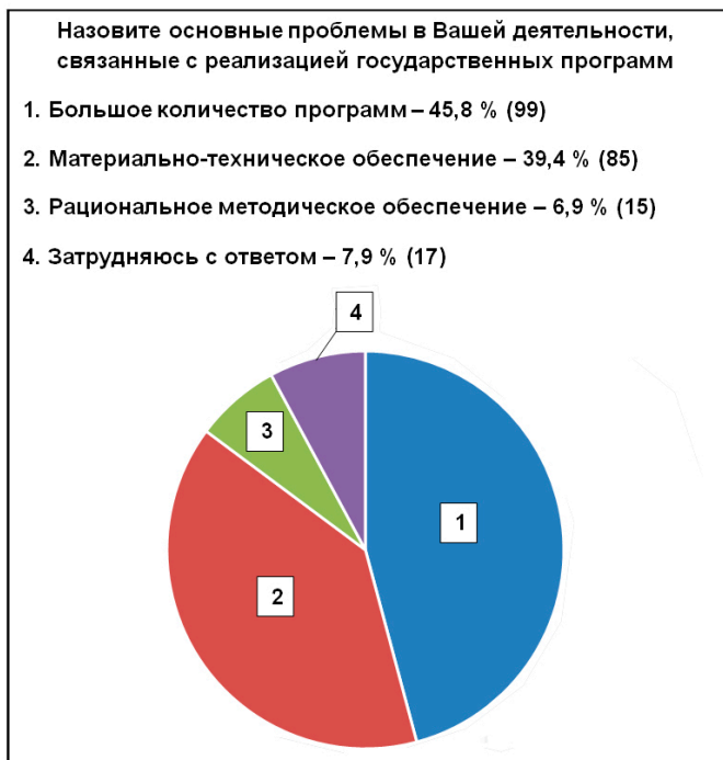
Рис. 2. Проблемы деятельности ОВД в процессе реализации государственных программ

ния и взаимной связи базовых понятий, таких как «цель», «задачи», «целевые показатели», «целевые индикаторы» и т. д.