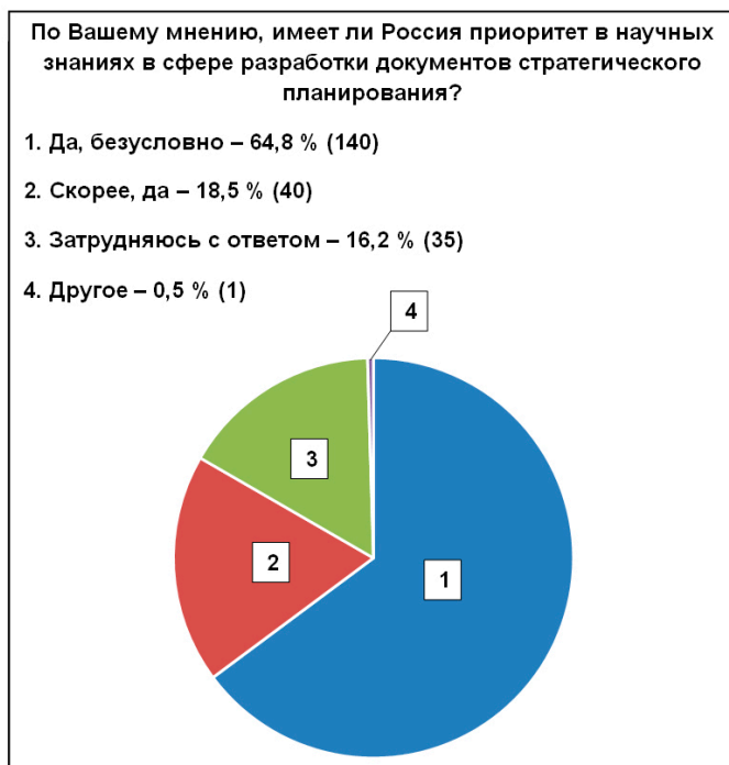
Рис. 1. Оценка экспертами приоритета российских знаний в разработке документов стратегического планирования

В связи с этим представляется оправданным и целесообразным обратиться к истории отечественного государственного управления, к анализу исторических, духовно-нравственных, теоретико-методологических, социальных и правовых основ российской государственности. Такой анализ поможет в выстраивании и совершенствовании современной концепции стратегического управления как на федеральном, так и на региональном уровне государственной власти.