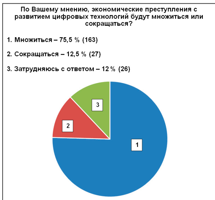
Рис. 4. Мнение экспертов об экономической преступности в условиях развития цифровых технологий

Можно ожидать, что новые цифровые технологии обусловят в целом усложнение оперативной обстановки на территориях ответственности органах внутренних дел, что неизбежно скажется на характере реализации многих государственных программ. Оперативная обстановка – это внешний и внутренний социально-психологический климат (комплекс условий), в котором ОВД реализуют правоохранительную и правоприменительную функции. Очевидно, что системный анализ оперативной обстановки – часть методического обеспечения реализации государственных программ в деятельности территориальных ОВД.