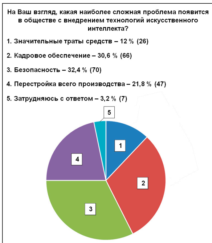
Рис. 5. Проблемы общества, актуализируемые с внедрением технологий искусственного интеллекта

родно-географических, административно-территориальных, экономических, социальных, демографических и иных факторов внешней среды позволяет повышать качество реализации государственных программ и корректировать организацию правоохранительной деятельности. Результаты исследования практики территориальных ОВД показывают, что анализ оперативной обстановки – это сложнейшая деятельность, предполагающая серьезную научную базу, а также использование самых разных источников информации: материалов различных проверок, документов статистической отчетности, коллегиальных форм работы (коллегии, совещания), результатов конкретных социолого-правовых исследований общественно-го мнения, материалов СМИ и многих других.