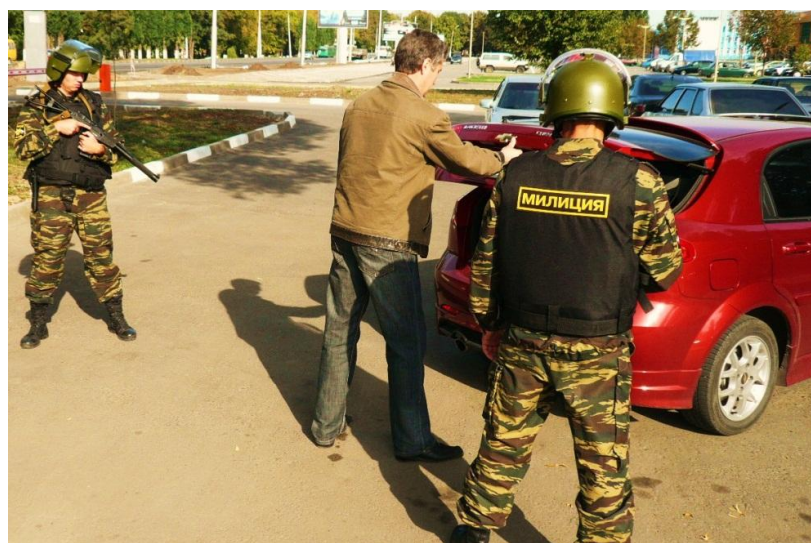
Рисунок 3. Способ осмотра багажника (вид сзади)