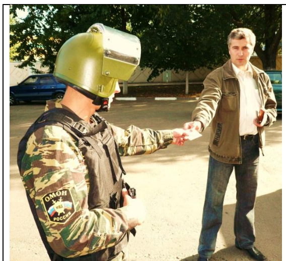
Рисунок 1. Безопасный способ проверки документов

В случае случайного или намеренного падения документов, сделав шаг назад, предложить водителю поднять их, в этот момент быть готовым к применению силы или оружия, так как в период наклона он может достать спрятанное оружие. При наличии напарника предложить водителю отойти в сторону, после чего самому поднять их. После получения документов не следует нагибаться, читая их, необходимо наблюдать за действиями водителя. При этом располагаться относительно водителя необходимо так, чтобы свет солнца в светлое время суток или фонарей уличного освещения в темное время был направлен в лицо водителя.