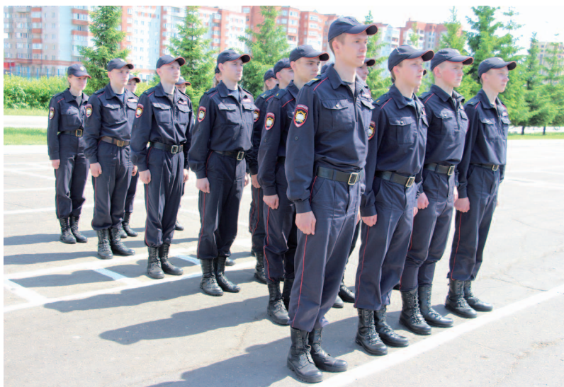
Рис. 6. Колонна

Колонна — это строй, в котором сотрудники расположены в затылок друг другу. Колонны могут быть по одному, по два, по три, по четыре и более человека. Колонны применяются для построения личного состава подразделений в походный строй (рис. 6).