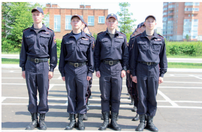
Рис. 27. Походный строй взвода на месте (колонна по три) (вид спереди)

Для этого он отдает приказ командиру первого отделения построить отделение в колонну по одному. После построения и выравнивания первого отделения левее него строит отделение командир второго отделения, левее за вторым располагается третье отделение. Интервал между отделениями должен быть в ширину ладони, а носки обуви одной шеренги обучающихся должны быть на одной линии, дистанция между шеренгами — на расстоянии вытянутой руки, положенной ладонью на плечо