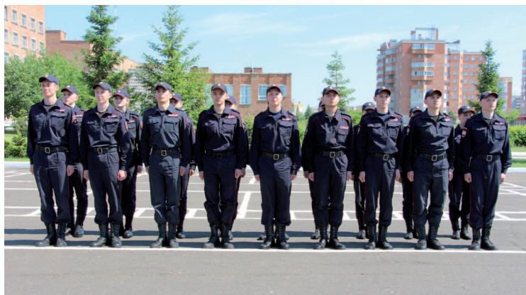
Рис. 26. Взвод в двухшереножном строю

По команде «Взвод, в две шеренги — становись!» отделения выстраиваются левее командира взвода, каждое в две шеренги. Интервалы между отделениями такие же, как и между двумя рядом стоящими обучающимися, т. е. на ширину ладони. В рядах обучающиеся задней шеренги должны стоять строго в затылок стоящим в первой шеренге. У обучающихся второй шеренги носки обуви должны быть на одной линии.