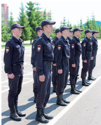
Рис. 15. Отделение в двухшереножном строю

После демонстрации и пояснения продолжается тренировка обучающихся по правильному и быстрому занятию своих мест в строю.