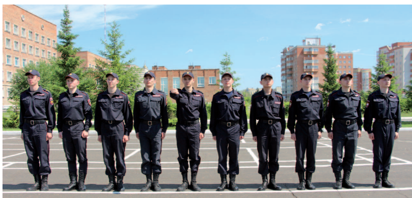
Рис. 17. Определение среднего в одношереножном строю

При размыкании от середины в команде указывается средний, который, услышав свою фамилию, отвечает: « Я » и вытягивает вперед руку (рис. 17).