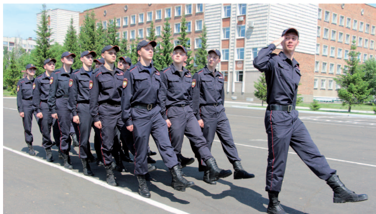
Рис. 30. Отдание воинского приветствия взводом в движении