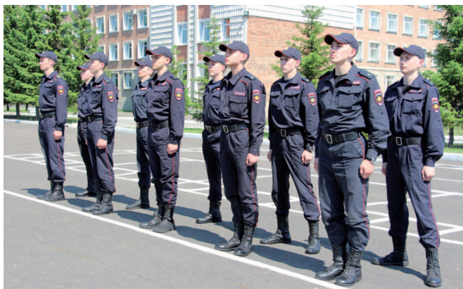
Рис. 21. Перенос правой ноги по кратчайшему пути в сторону