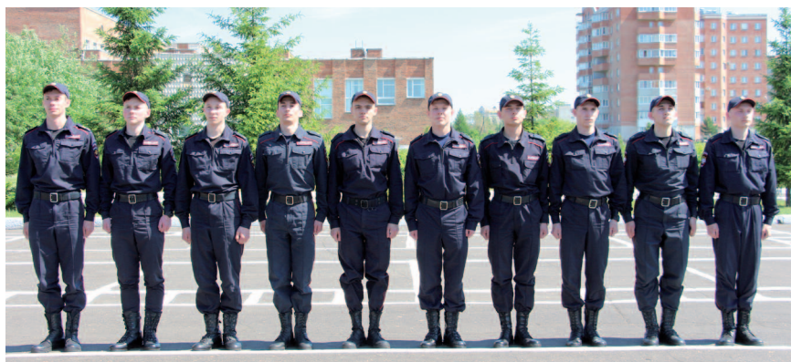
Рис. 1. Шеренга

Шеренга — строй, в котором сотрудники размещены на одной линии, один возле другого (рис. 1).