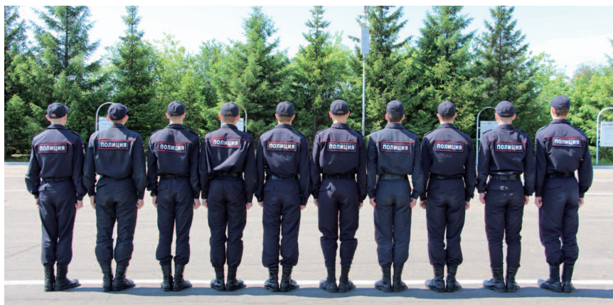
Рис. 3. Тыльная сторона строя

Тыльная сторона строя — сторона, противоположная фронту (рис. 3).