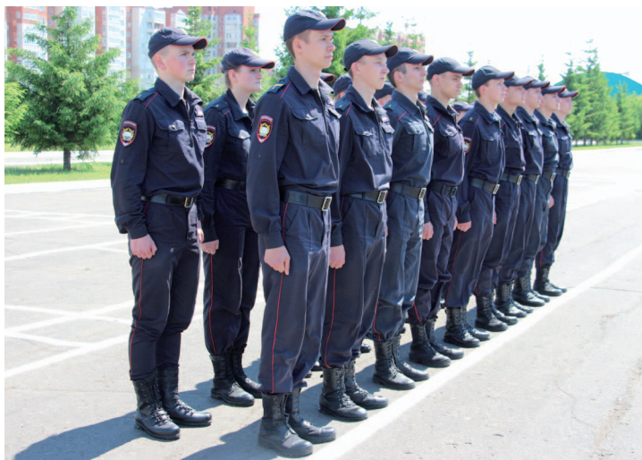
Рис. 5. Двухшереножный строй

Двухшереножный строй — построение, при котором сотрудники одной шеренги расположены в затылок сотрудникам другой шеренги на дистанции одного шага (рис. 5).