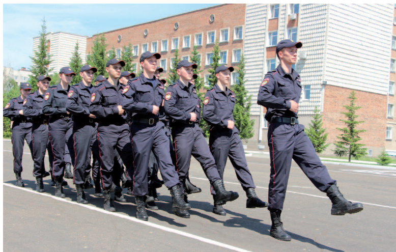
Рис. 29. Походный строй взвода в движении (колонна по три)

впередистоящего. В отделениях обучающиеся должны стоять строго в затылок друг другу.