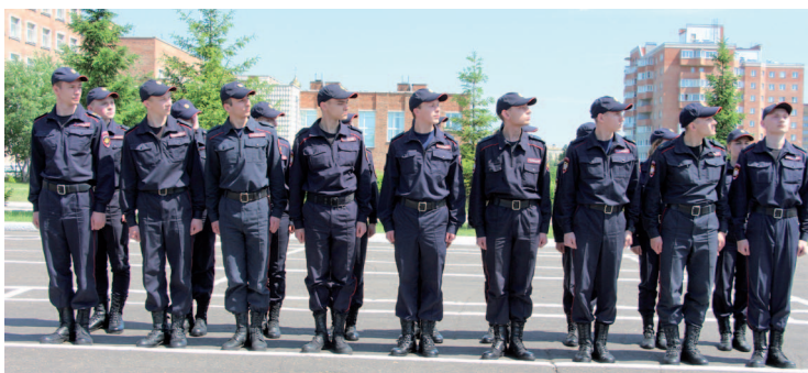
Рис. 24. Действия подразделения по команде «Равнение налево!»

— командир отделения, отдав рапорт и не опуская руку от головного убора, делает левой (правой) ногой шаг в сторону с одновременным поворотом направо (налево) и, пропустив начальника вперед, следует за ним на расстоянии одного-двух шагов позади, с внешней стороны строя;