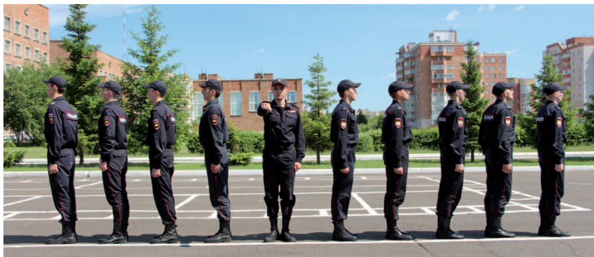
Рис. 18. Поворот в сторону для размыкания от середины

По счету « Делай — раз! » осуществляется поворот в указанную сторону без приставления сзади стоящей ноги. По счету « Делай — два! » приставляется сзади стоящая нога и одновременно поворачивается голова в сторону фронта построения. Голова должна быть повернута так, чтобы можно было увидеть через плечо сзади стоящего сотрудника, положение корпуса при этом сохраняется (рис. 18).