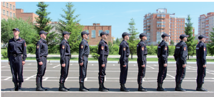
Рис. 16. Размыкание отделения влево в одношереножном строю

Для размыкания отделения на месте на один шаг и более подается команда « Отделение, вправо (влево, от середины) — разомкнись! » или « Отделение, вправо (влево, от середины), на ... шагов — разомкнись (бегом — разомкнись!) ». Если интервал не был озвучен, размыкание производится на один шаг (рис. 16).