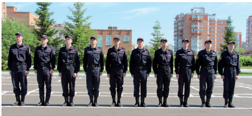
Рис. 25. Развернутый одношереножный строй

Для построения взвода подается команда « Взвод, в одну шеренгу — становись! ». По этой команде первое отделение выстраивается в одну шеренгу левее командира взвода, левее первого отделения — второе, на левом фланге — третье отделение. При этом у всех обучающихся в шеренге носки обуви должны быть на одной линии, а положение корпуса — как при строевой стойке.