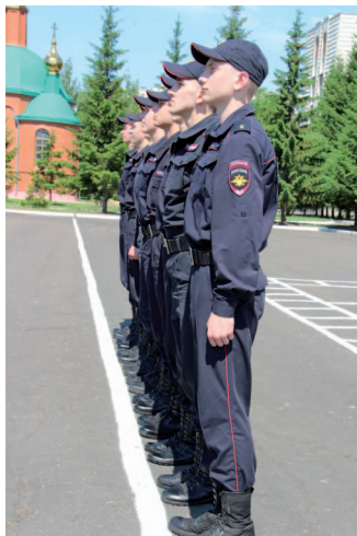
Рис. 2. Фланг развернутого одношереножного строя

Фланг — правая (левая) оконечность строя. При поворотах строя названия флангов не меняются (рис. 2).