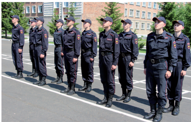
Рис. 22. Принятие строевой стойки