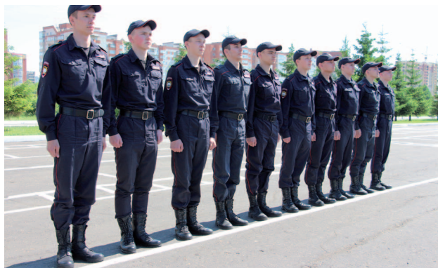
Рис. 14. Отделение в одношереножном строю

Свое место в строю сотрудники полиции занимают по команде « Становись! » (рис. 14).