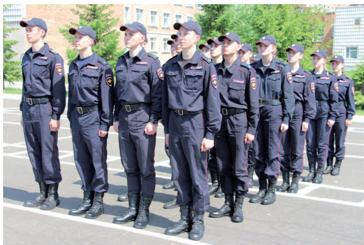
Рис. 28. Походный строй взвода на месте (колонна по три) (вид сбоку)