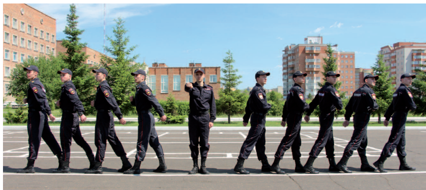
Рис. 19. Размыкание отделения от середины

По счету « Делай — три! » начинается движение учащимся полушагом (бегом), при этом смотреть нужно через плечо на идущего сзади и не отрываться от него. После остановки сзади идущего делается шаг или столько шагов, сколько было озвучено в команде, затем остановка и поворот (рис. 19).