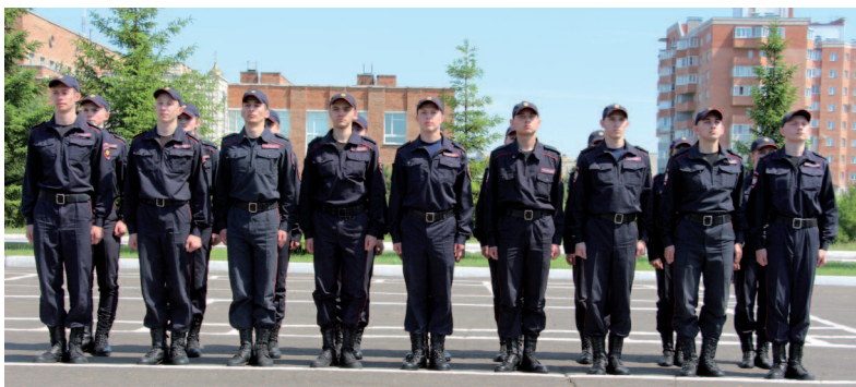
Рис. 23. Действия подразделения по команде «Смирно!»