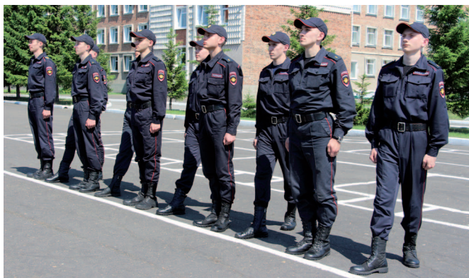
Рис. 20. Шаг левой ногой назад, не приставляя правую