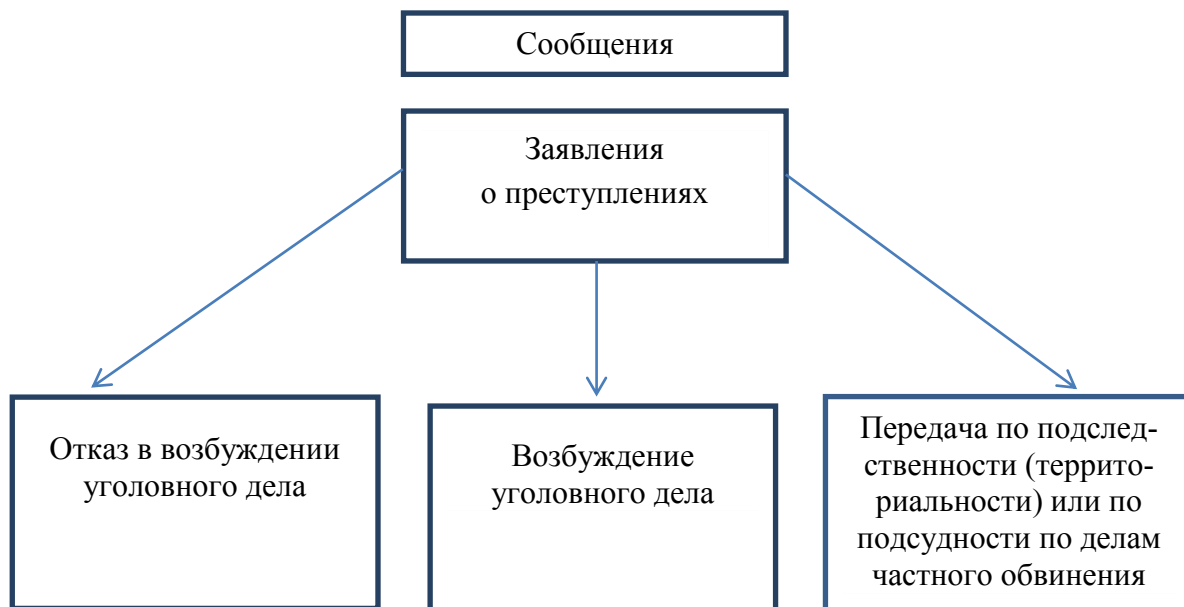
Схема приема, регистрации и разрешения сообщений и иной информации о происшествии, поступивших в органы внутренних дел