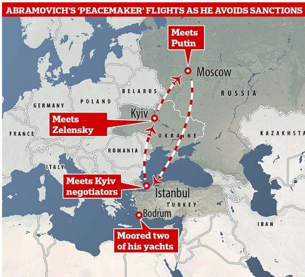
СХЕМА ПОЛЕТОВ АБРАМОВИЧА