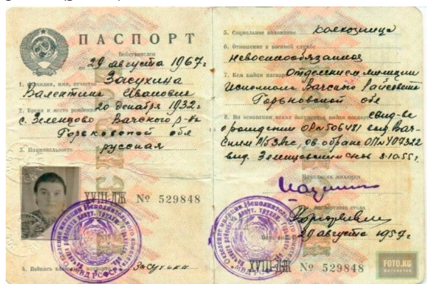
Рис. 3. Паспорт образца 1957 г.

В соответствии с положением о паспортах, утвержденным Советом Министров СССР 21 октября 1953 г., был установлен паспорт единого образца (рис. 3).