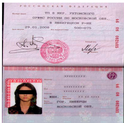
Рис. 5. Паспорт образца 2007 г.

рации страниц). С 1 марта 2007 г. в соответствии с указанным постановлением стали выдаваться паспорта только нового образца.