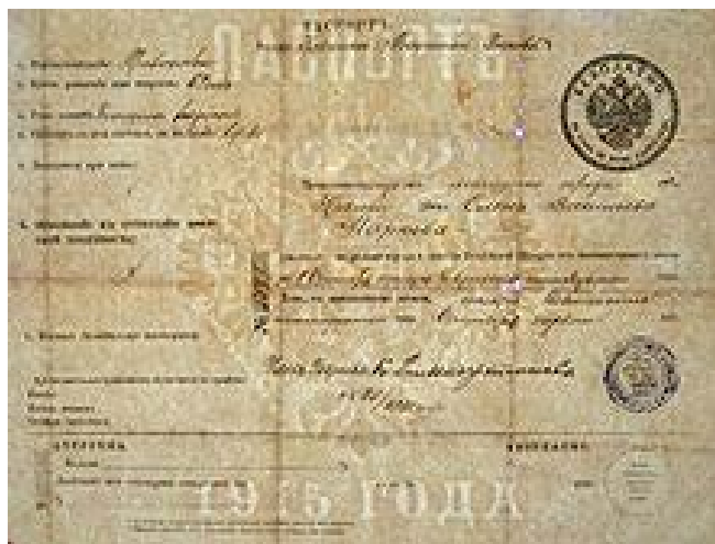
Рис. 1. Паспорт образца 1915 г.

ствовали вплоть до Февральской буржуазно-демократической революции 1917 г.