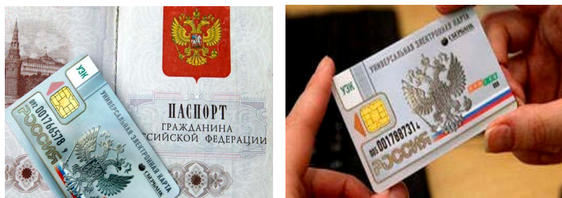
Рис. 6. Универсальная электронная карта образца 2015 г.

Не исключено, что данный период начнется с момента, когда предположения, высказанные в настоящем исследовании, будут официально закреплены на законодательном уровне и найдут свое отражение в нормативных правовых актах. Этот будущий (шестой) этап может носить условное название «интегрированный».