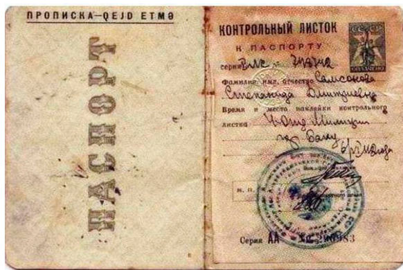
Рис. 2. Паспорт образца 1932 г.

Следующий этап берет свое начало с 1932 г. – это время введения единой паспортной системы, которая, как и ее информационное обеспечение, в последующие годы совершенствовалась с целью укрепления государства, улучшения обслуживания населения. С октября 1937 г. в паспорта стали клеивать фотографию. В этот период учеты населения велись исключительно в бумажном виде в форме картотек.