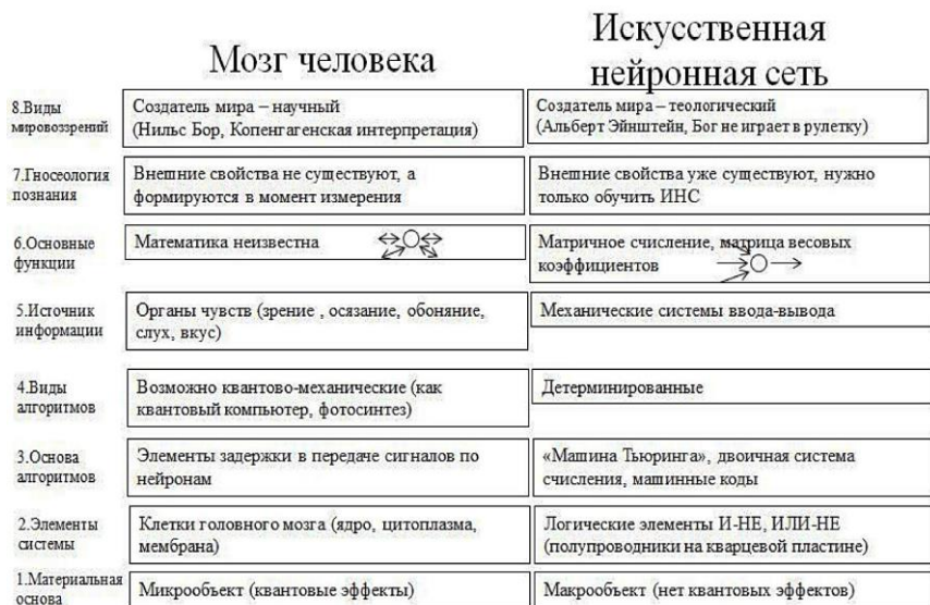
Рис 1. Сравнительный анализ системы «головной мозг человека» и системы «искусственная нейронная сеть».

— ИНС — Создатель мира — теологический (известная фраза Альберта Эйнштейна: «Бог не играет в рулетку»).